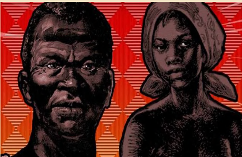
Ilustração de Zumbi e Dandara (Autoria desconhecida)

Nessa sentido, a biblioteca do Campus São Sebastião realiza a Mostra Narrativas Negras , de 20 de novembro a 20 de dezembro de 2023.